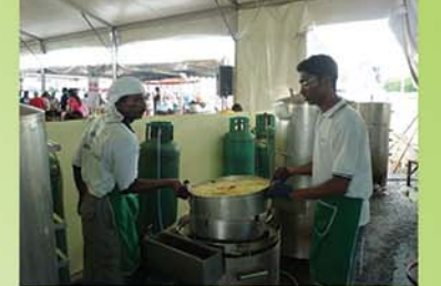
Cooking of Rice using Special Steamers சாதம் தயாராகிறது