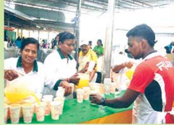
Distributing drinks பானங்கள் விநியோகத்தம் இடம்