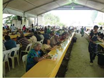
Food Serving Area உணவு பரிமாறும்படம் இடம்