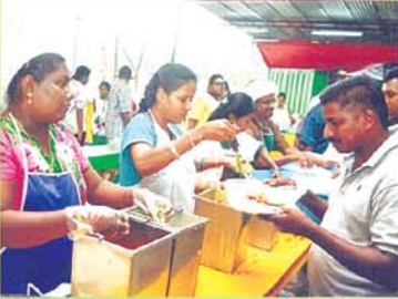
Serving Foods உணவு பரிமாறுதல்