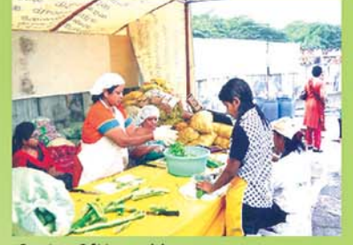
Cutting Of Vegetables காய்கறிகளை நறுக்கதல்