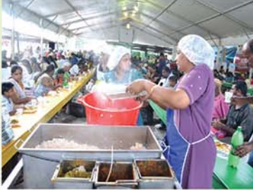
Food distribution site உணவு விநியோகத்தம் இடம்