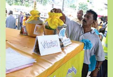
Donation Counter நன்கொடை பீர்பு