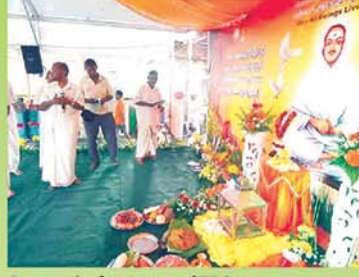
Prayers before start of TFC அன்னதானத்திற்கு முன் பணியியல் குலத்தல் பிரார்த்தனை