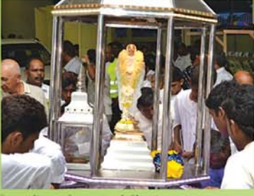
Ramalinga Swamikal Chariot இராமலிங்க சுவாமிகளின் பல்லாக்க