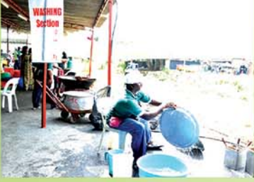
Process of Cleaning/Washing உணவு பொருட்கள் சுத்தம் செய்தல்