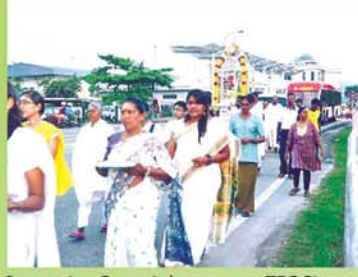
Procession From Ashramam to TFC Site ஆசிரமத்திலிருந்து அன்னதான இடத்திற்கு செல்லும் ஊர்வலம்