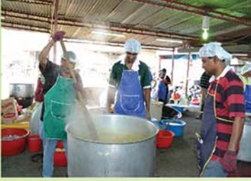
Preparation of Sambar சாம்பார் தயாராகிறது